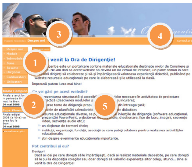
Figura 1. Interfața portalului „Ora de dirigenție”

Fiecare pagină a portalului are cinci zone active: